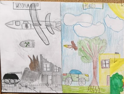
Piotr Ferenc kl. 3b