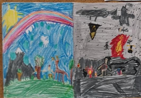
Tymek Pietrucha kl. 2a