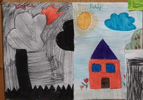
Ewa Czuryło kl. 2c